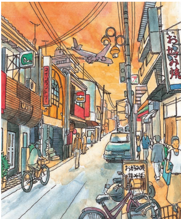
駅から西側に続く商店街の風景。

ホームの屋根から突き出た大きな桶が特徴的な服部駅。降りれば、下町情緒漂う商店が並ぶ。近くの服部天神宮へお参りしたら、地元で話題のお店を巡ってあちらこちらへ。この町ならではの魅力を探しに、さあ“ちょい駅散歩”を始めよう!