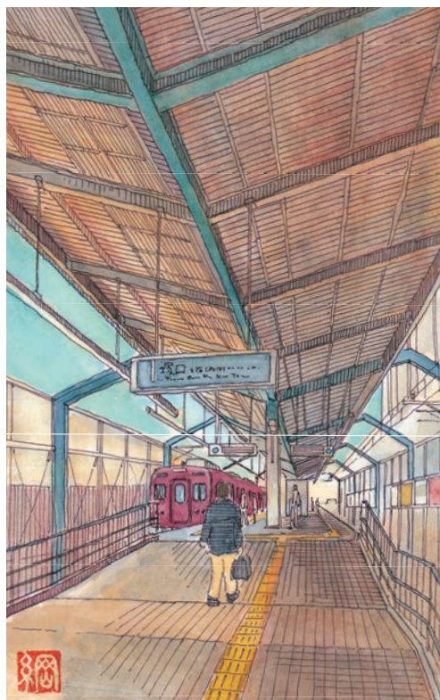
伊丹駅 所在地/兵庫県伊丹市西台 設置/1920年7月16日

伊丹線の終着駅・伊丹駅周辺は、再開発されにぎわう一方、少し歩くと酒造で栄えた面影を残す街並みが広がる。酒蔵や町家は今も大切に受け継がれ、地元で愛される店の主たちは老舗の技を伝えている。古きと新しきが融合する、街の魅力に酔いしれよう。