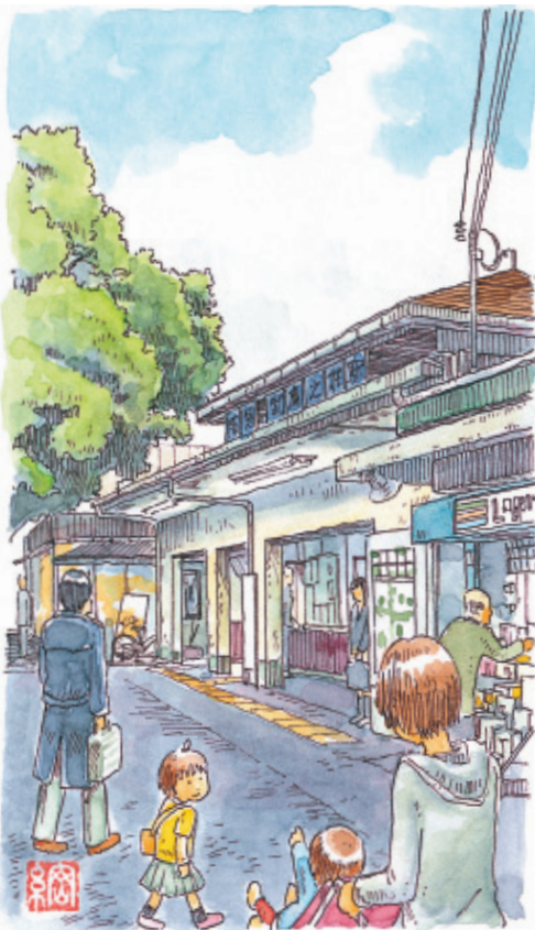
武庫之荘駅 | 所在地 / 尼崎市武庫之荘1丁目 設置 / 1937年10月20日

武庫之荘駅周辺は、阪神間モダニズムを感じさせる住宅地であり、また最近ではグルメもなるレストランやおしゃれなカフェ、雑貨店などが増え、熱い注目を集めているエリア。うらかな日差しの中、おいしいお弁当を持って、のんびりと春の散歩をしてみよう。