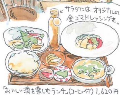
おいしい満ち楽しむランチ(コーヒー付) 1,620円

●ランチ12:00～売り切れ次第終了、カフェ14:00～日没/月曜休(日曜・祝日は貸し切りの場合があるため事前に電話で確認を) ☎06・6852・8826