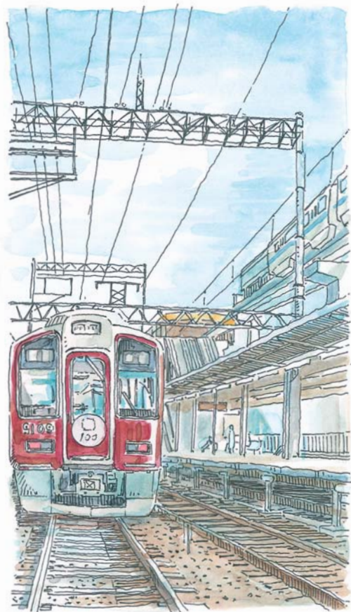
蛸池駅 所在地/豊中市蛸池東町 設置/1910年4月25日

大阪モノレールと連絡する同駅は、電車が到着する度に伊丹空港へ向かうビジネスマンや旅行者が大きな荷物を持って慌ただしく行き来する。そんな光景とは対照的に、一歩改札を出ればゆったり時間が流れる街で、ほっこりスポットを探して歩こう。