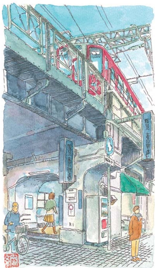
春日野道駅 所在地/神戸市中央区国香通 設置/1936年4月1日

駅周辺には、春日野道商店街、大安亭市場などの商店街が集まり、高架下にはラーメン屋、居酒屋、お好み焼き屋などが並ぶ。一駅隣にある神戸一の繁華街・三宮とは対照的な下町情緒あふれる町で、市場巡りに、食べ歩きと、おいしい散歩に出かけよう!