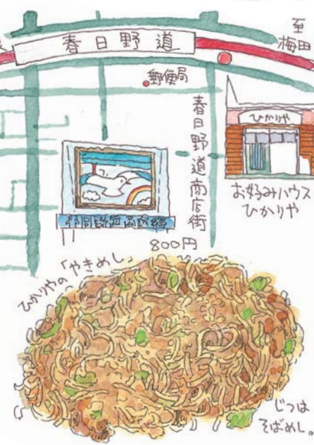
◎そのほか「モダン焼」800円もおすすめ。全商品テイクアウトもできる。 ●11:00～22:00(L021:30)/日曜休 ☎078-231-3467