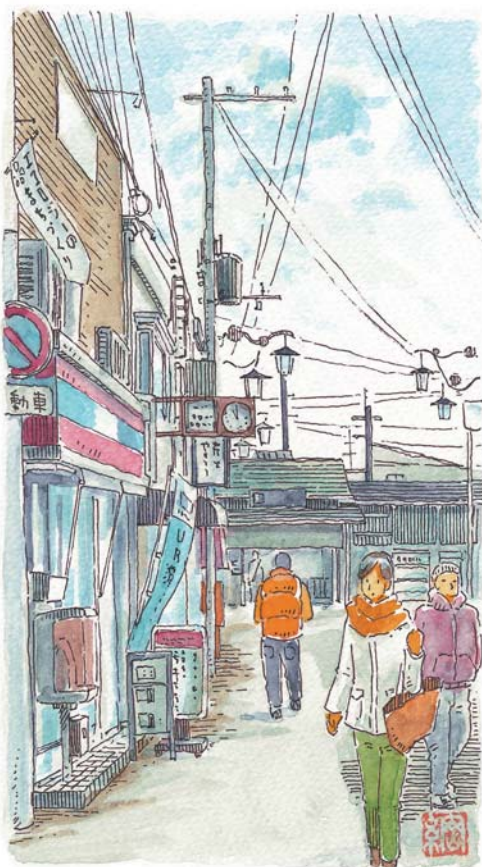
桜井駅 | 所在地/箕面市桜井 設置/1910年4月12日