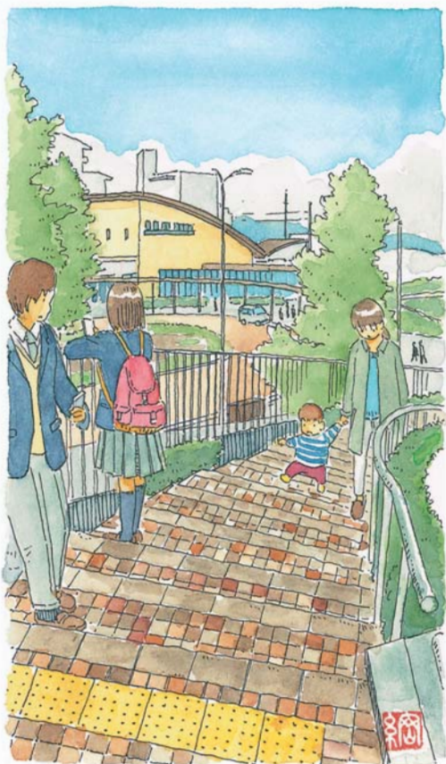
摂津市駅 | 所在地/摂津市千里丘東設置/2010年3月14日

CO 2 排出量ゼロを目指す全国初の駅として2010年に開業した摂津市駅。かつては企業の寮などに住む単身者が多かったという街も今では家族連れが目立つように。駅と足並みをそろえるように緑豊かな街づくりが進む駅周辺で、人々の温かい笑顔と出合った。